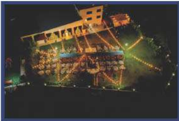
ÇÖKELEZ Kır Salonumuz ( 1500 Kişilik )